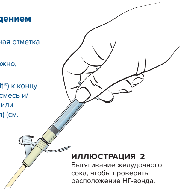
ИЛЛЮСТРАЦИЯ 2 Вытягивание желудочного сока, чтобы проверить расположение НГ-зонда.